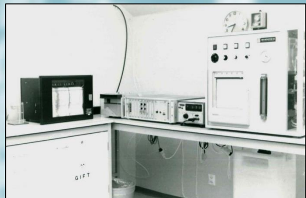
Mätstationen på Rådhuset i Malmö under 70 talet.

1969 startades en första kontinuerlig mätning av SO 2 genom medverkan i ett riksprojekt. Detta ledde till uppbyggnad av mätstationen på Rådhuset som visas nedan.