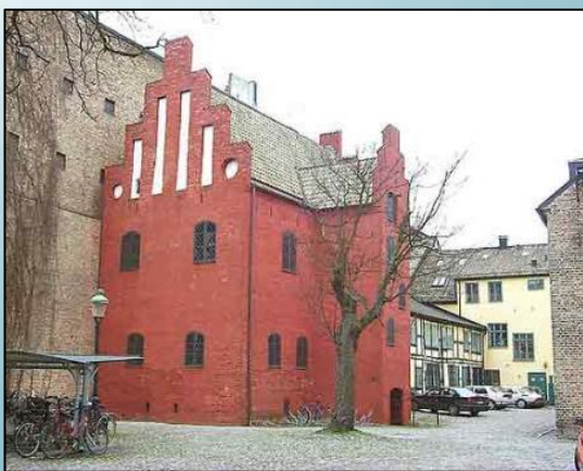
Kompanihuset i Malmö