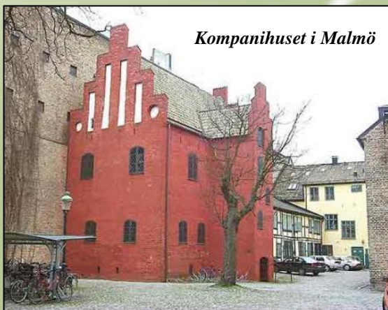
Kompanihuset i Malmö

OBS! Anmälan till lunch och workshop görs individuellt via e-mail adressen som anges på den bifogade inbjudan senast 3 december.