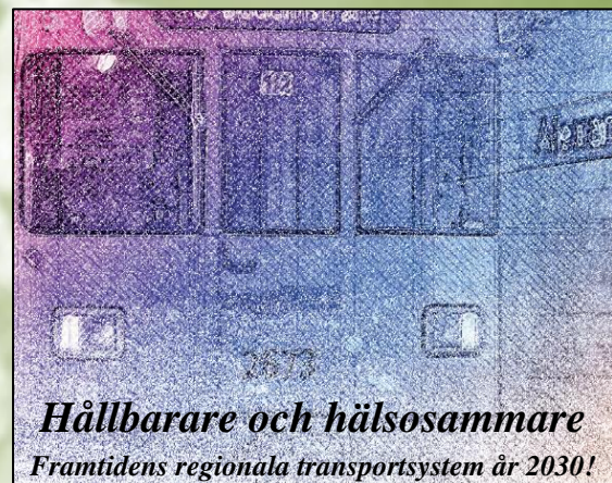
Hållbarare och hälsosammare Framtidens regionala transportsystem år 2030!