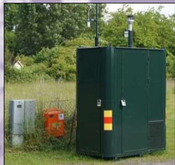
Den mobila mätvagnen vid Lernacken i Malmö.

Parametrar som kan mätas med den mobila mätstationen är kväveoxider (NO x ) och NO 2 samt partiklar (PM 10 eller PM 2,5 ). Kostnaden för inhyring är 50 000 kronor första månaden och 25 000 efterföljande månaderna. Kontakta oss för mer info.